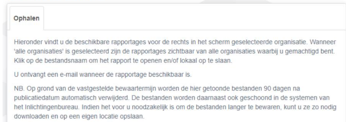
Afbeelding 2: Tabblad Ophalen