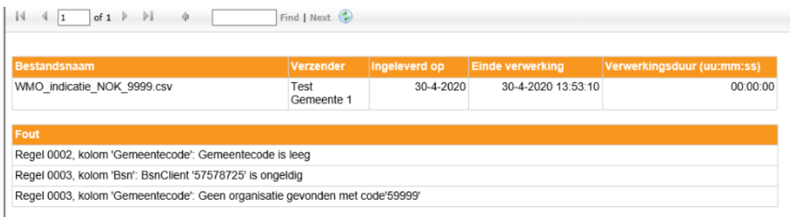
Afbeelding Verwerkingsverslag met fouten

Het verwerkingsverslag is een rapportage waarin wordt aangegeven in welke mate de door een gemeente aangeleverde bestanden succesvol zijn verwerkt.