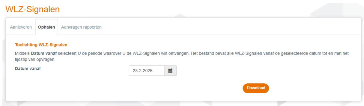
Afbeelding Schermafdruck Wlz signalen ophaaltblad

Ik wil alle Wlz-signalen ophalen vanaf 23-02-2026 tot 20-05-2026 09:37. De tot-datum komt dus overeen met het moment van bevraging. Hierdoor beschikt de bevrager altijd over de meest recente gegevens.