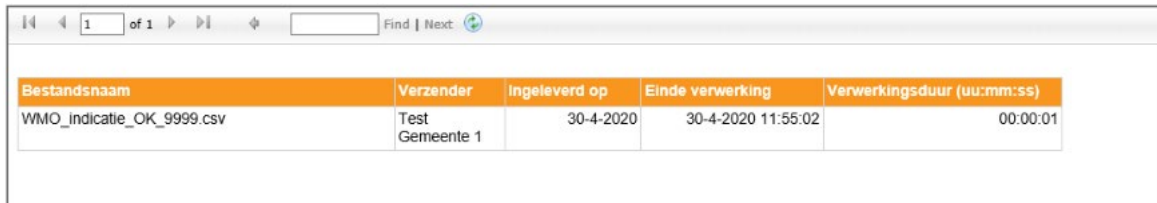
Afbeelding Verwerkingsverslag zonder fouten

Na de verwerking van de aangeleverde Wmo gegevens wordt een verwerkingsverslag aangemaakt en in het portaal geplaatst zodat de gemeente dit verslag kan downloaden. Klik hiervoor in het tabblad Wlz signalen op de knop afgekeurd/afgeleverd, achter het aangeleverde bestand.